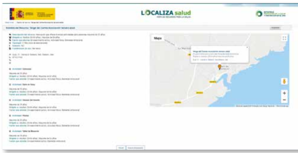
Figura 4. Informació detallada d'un recurs concret