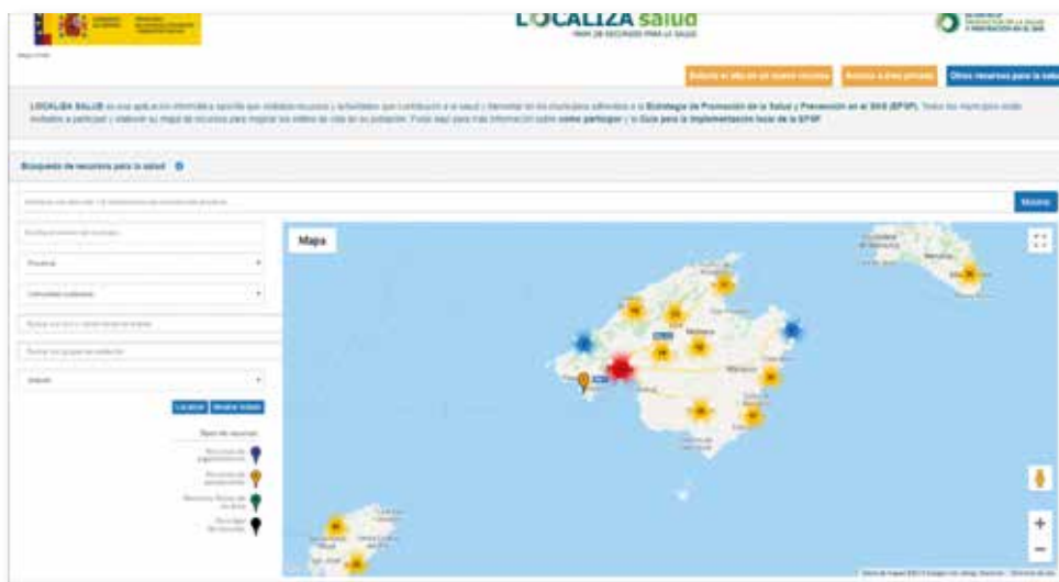
Figura 1. Mapa d'actius a les Illes Balears